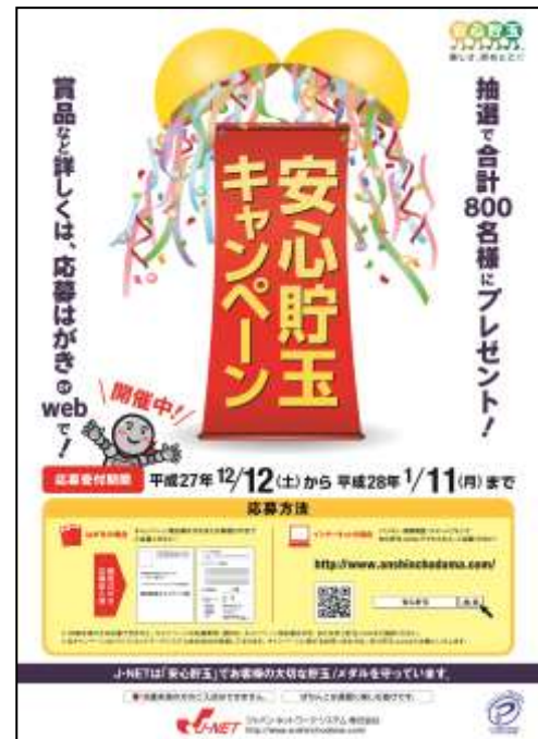
安心貯玉キャンペーンポスターイメージ

主なアンケート項目は「貯玉／メダル・再プレーの利用度」「貯玉補償制度の認識」「補償上限値の認識」等です。