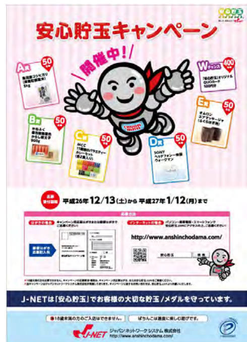
安心貯玉キャンペーンポスターイメージ

主なアンケート項目は「貯玉/メダル・再プレーの利用度」「貯玉補償制度の認識」「補償上限値の認識」等です。